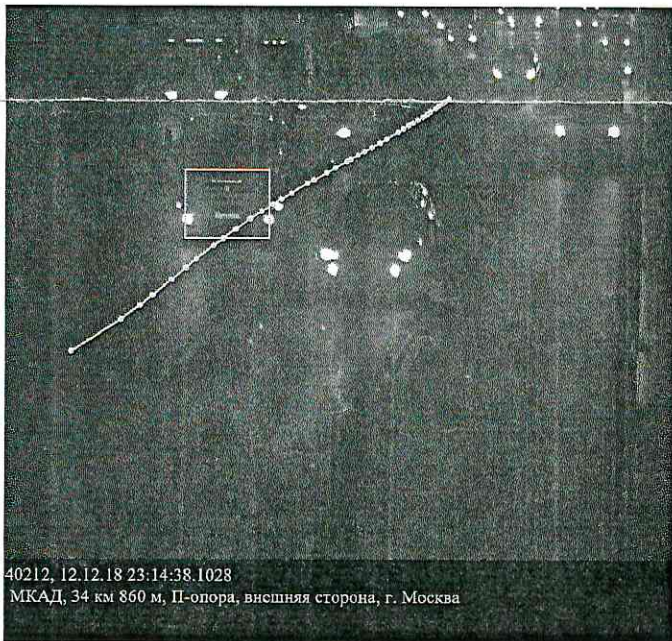
40212, 12.12.18 23:14:38.1028 МКАД, 34 км 860 м, П-опора, внешняя сторона, г. Москва